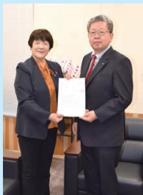
谷中鹿沼市議会議長